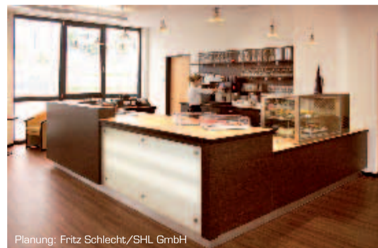
Planung: Fritz Schlecht/SHL GmbH