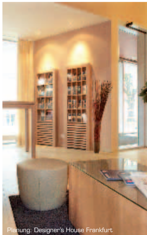
Planung: Designer's House Frankfurt