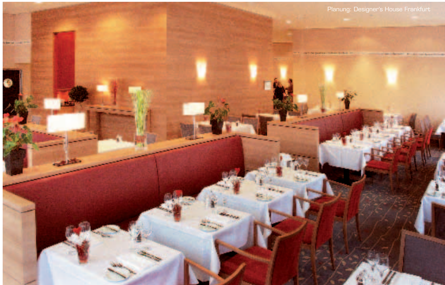
Planung: Designer's House Frankfurt

Wo bisher das Design im Mittelpunkt stand, ist heute Nachhaltigkeit und Umweltverträglichkeit erwünscht. Warme Erdtöne und Holzstrukturen sind ebenso gefragt wie Farben in allen kräftigen Ausführungen. Theken, Sideboards oder Solitär Möbel aus stark gemaserten Massivhölzern sind gefragter denn je und bilden edle Wohnelemente, die sich mit unterschiedlichen Accessoires kombinieren lassen. In vielen Design-Varianten kommt die Naturverbundenheit immer wieder zum Ausdruck, die sich in der Verwendung der unterschiedlichen Naturhölzer bemerkbar macht. Neben heimischen Hölzern wie Kirschbaum, Buche oder Ahorn sind auch wertvolle Hölzer wie kaukasischer Nussbaum und indischer Apfel begehrt. Um der Ökobilanz auch im Bereich der Bezugstoffe künftig einen Tribut zu leisten werden die bisherigen Stoff- und Lederkollektionen vor allem durch Naturfasern wie Wolle, Baumwolle, Leinen und Flachs ergänzt.