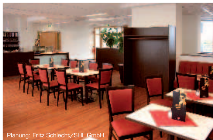
Planung: Fritz Schlecht/SHL GmbH

dem Balanceakt mit den Wünschen des Käufers nach Luxus und dem Anspruch an einen umweltbewussten Umgang mit der Natur gerecht zu werden. Auch im Hause Fritz Schlecht/SHL GmbH folgt man diesem Gedanken und wartet mit ökologisch vertretbaren Bilanzen auf, die anerkannte Zertifizierungen und garantierte Lebenszyklen ihrer Produkte beinhalten.